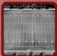
Terrain CCL Ste Catherine