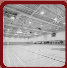
Gymnase Triple CCL