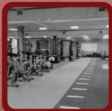
Salle de Gym CCL