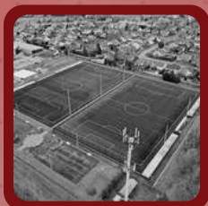
Pôle Culturel et Sportif Saint Constant