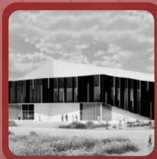
Centre Intérieur (2025) Ste Catherine